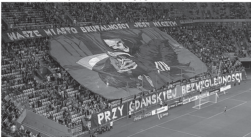
Rysunek 3. Oprawa meczu Lechia Gdańsk – Legia Warszawa z 03.05.2012 r.

Kibice, będąc wielką grupą, czują się bezkarni, a zarazem wolni i często wyrażają poglądy sprzeczne z polityką państwa. W latach osiemdziesiątych XX wieku ówczesni kibice Lechii Gdańsk zamiast dopingować swoich piłkarzy, szczególnie podczas meczów wyjazdowych, skandowali hasła polityczne takie jak: „Nie ma wolności bez Solidarności!”, „Precz z komuną!” czy „Znajdzie się pała na dupę generała!” [3, s. 44–45].